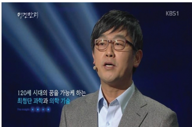
< 2016. 4. 1. KBS 명견만리, 120세 시대 쇼크 >