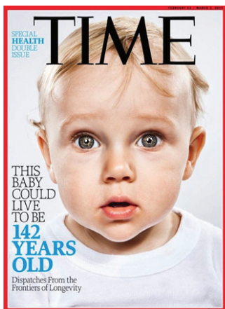
< 2015. 2. 23. Times지 표지 >